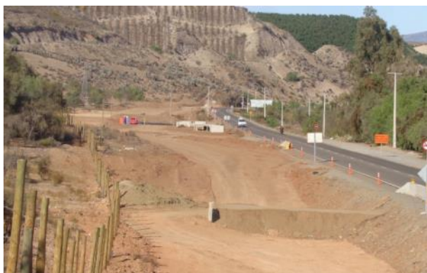
Imagen N°04. Trabajos Sector Recoleta