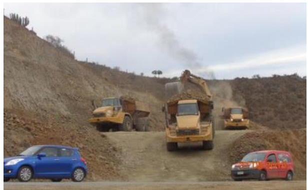
Imagen N°03 Trabajos de Corte Las Cardas