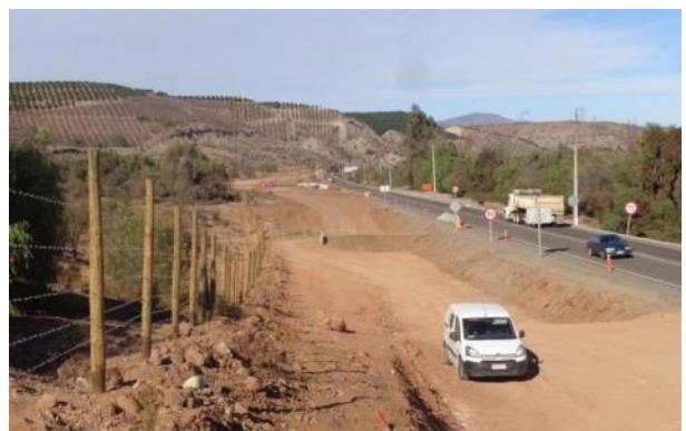
Imagen N°05. Trabajos Sector Recoleta