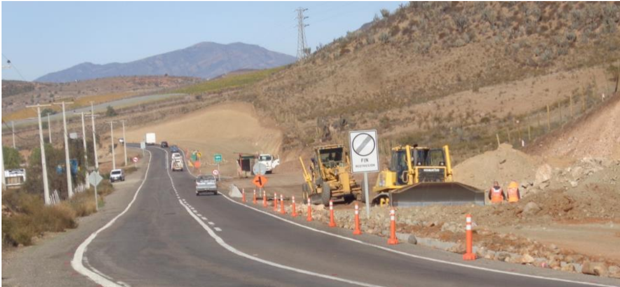
Imagen N°01. Trabajos Movimientos de Tierra