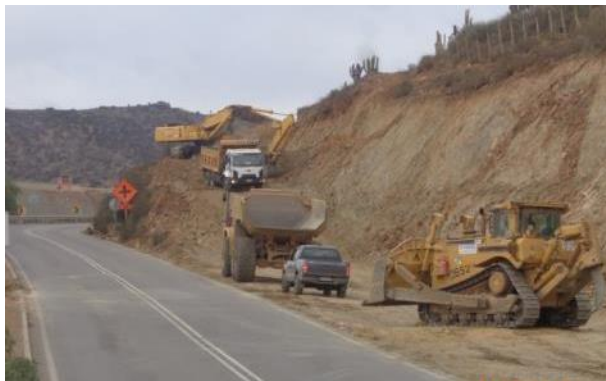
Imagen N°02 Trabajos de Corte Las Cardas